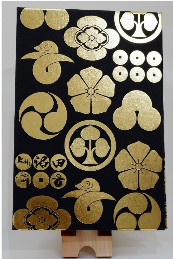
⑧沼田城御城印帳(黒)裏面